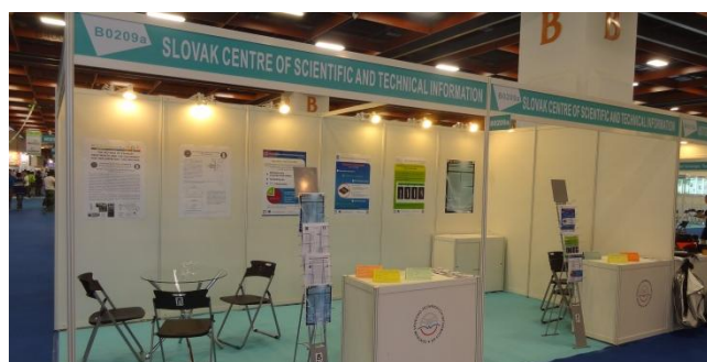
Stánok slovenských vynálezov