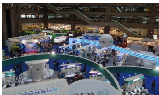
Výstavné priestory TWTC