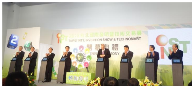
Slávnostné otvorenie za účasti vrcholných predstaviteľov relevantných štátnych orgánov, vrátane vice-prezidenta Taiwanu

Dosiahnuté úspechy slovenských vynálezov na medzinárodnej pôde dokazujú, že aj na Slovensku sú produkované kvalitné vedecké výstupy, ktoré však často ostávajú „ukryté“ pred očami potenciálnych investorov ochotných dané výstupy využiť v priemyselnej praxi. Je preto potrebné venovať dostatočnú pozornosť aj aktívnej propagácii dosiahnutých výsledkov výskumno-vývojovej činnosti a vyhľadávaniu partnerov na ich komerčné zhodnotenie. Veríme, že prezentácia predmetných výsledkov na veľtrhu vynálezov a technológií v Taipei dopomôže k nájdeniu takýchto partnerov a potenciálnych investorov z priemyselného sektora a zrealizovaniu úspešného transferu týchto poznatkov do praxe.