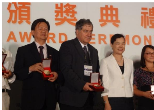
Slávnostné udeľovanie ocenení