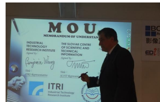
Podpis Memoranda o porozumení